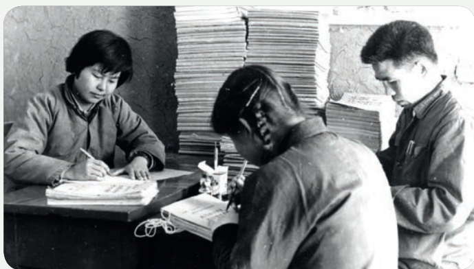
樊女士於敦煌研究院工作（1964年）

當時敦煌的生活環境惡劣，缺水缺電，家人也不在身邊。即使如此，樊女士依然被莫高窟的美及歷史深深吸引，在工作崗位上堅持了50多年。期間遇到的種種困難和阻滯，樊女士都以堅強的意志和樂觀的精神扛了過去。