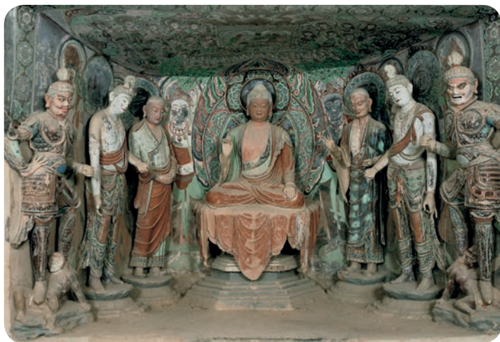
第45窟西壁佛龕彩塑，以佛像為中心，按身份等級侍列成對弟子、菩薩、天王，因應身份的不同，人物的表情和氣質各異造就有靜有動、文武並俱的活躍氣氛，被認為是莫高窟盛唐時期最具代表性的一鋪彩塑。