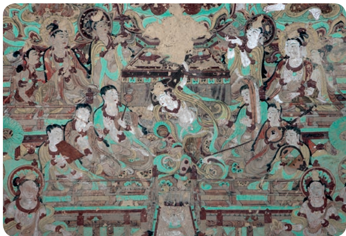
第112窟反彈琵琶舞樂圖，線條純熟、自然，線條的主次，墨色的濃淡，起筆收筆停頓轉折，都與人物形體姿態和神情密切相連。壁畫敷彩以朱綠黃黑白為主色，形成溫和而厚重的色彩美，且色澤歷千餘年而不變，殊為罕見。

時至今日，全賴以樊女士為代表的「莫高窟人」的艱辛工作，莫高窟才得以成為中西文化薈萃的寶庫，讓歷史、藝術及文化交流得以傳承，孕育世界文明。