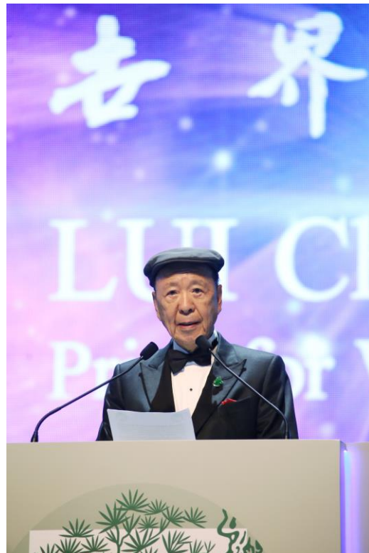
「呂志和獎－世界文明獎」創辦人呂志和博士。