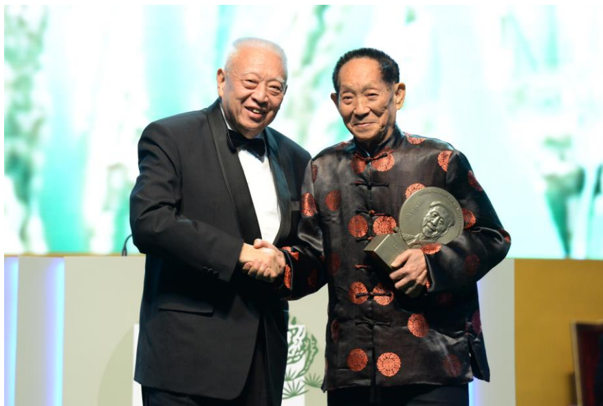
2016年「呂志和獎－世界文明獎」-「持續發展獎」獲獎者袁隆平教授。