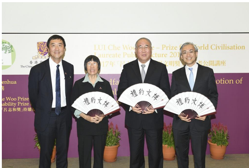
由左起：香港中文大學校長沈祖堯教授、極地博物館基金創會人李樂詩博士、「持續發展獎」獲獎者解振華先生及香港天文台台長岑智明先生