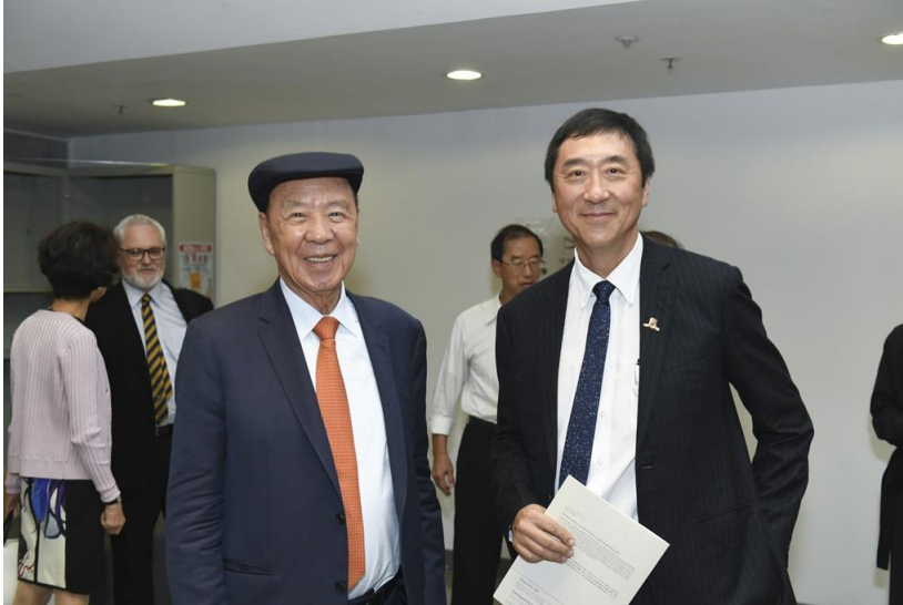
「呂志和獎—世界文明獎」創辦人呂志和博士與香港中文大學校長沈祖堯教授合照。