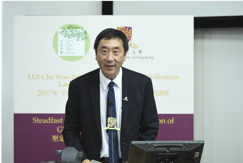
香港中文大學校長沈祖堯教授