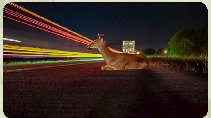
一隻小鹿在內華達州49號高速公路的路邊休息

TNC最近發表《城市世紀》研究報告，指出城市化可能帶來的不同影響，包括導致動物失去棲息地。單在未來二十年，就可能有多達29萬平方公里的自然棲息地受到威脅。