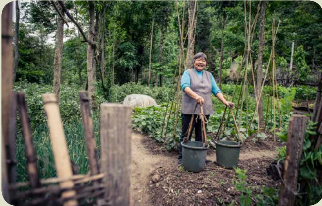
一名來自四川省民主村的農婦在她的農圃工作

在中國，TNC於接近11,000公頃的森林實施碳補償計劃，至今已栽種近2,400萬棵樹苗，預計可以抵銷大約260萬公噸的二氧化碳。