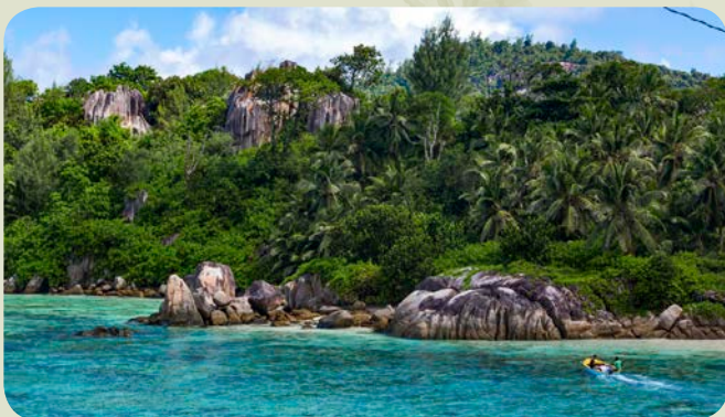
TNC NatureVest利用已收集的資本和撥款，協助塞舌爾債務重組以加強環境保護工作

TNC與塞舌爾共和國政府達成以外債換取自然保育的協議，將其部分國債抵銷成2,200萬美元的環境保護投資。(債務換環境計劃)