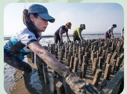
在后海灣流浮山興建試驗礁

在2019年，TNC與政府及其他合作夥伴，在下白泥的鴨仔坑士多建立首個永久的香港珍貴蠔礁展覽館，展示已有700年歷史的本地后海灣文化及有關養殖蠔的科學知識，以及蠔的多種益處。